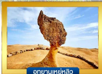
อุทยานเหย์หลิว