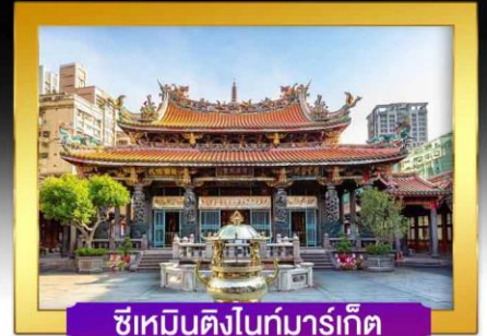
ซีเหมินติงไนท์มาร์เก็ต