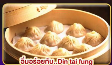
อิมอร้อยกับ..Din tai fung ร้านน้ำชาบนจิวเฟิ่น / New mala hotpot