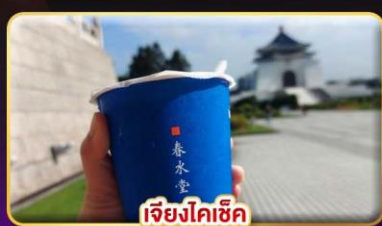
เจียงไคเช็ก พิเศษ..ชาวมังชูกินต้อนรับ