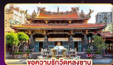
ขอความปรกิติหลังชาน