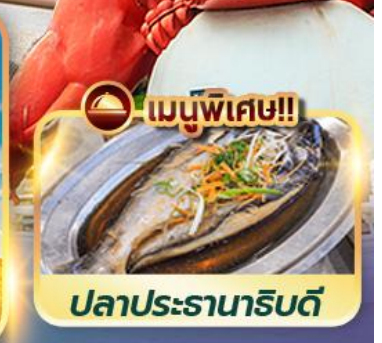
เมนูพิเศษ!! ปลาประรานาธิบดี