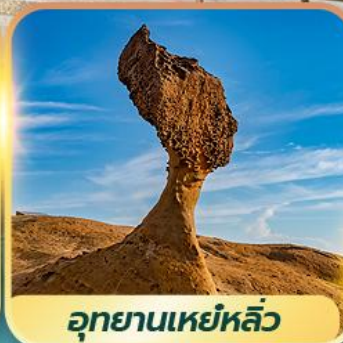
อุทยานเหย์หลิว