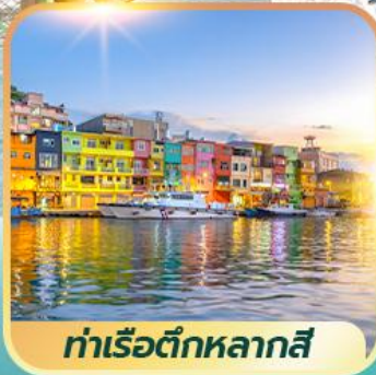
ท่าเรือตึกหลากสี