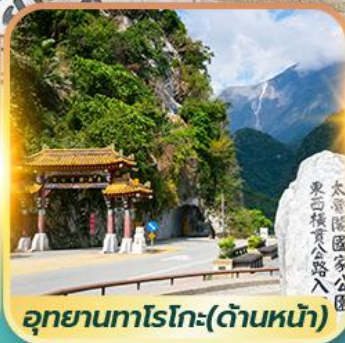
อุทยานทาโรโกะ(ด้านหน้า)