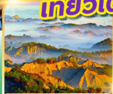
อุทยานหิน ไทพระจันทร์

พักซีเหมินติง 2 คืน!! เที่ยวเต็ม!! ไม่มีวันอิสระ