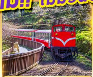
อุทยานอาลีซาน