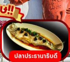
ปลาประรานาธิบดี