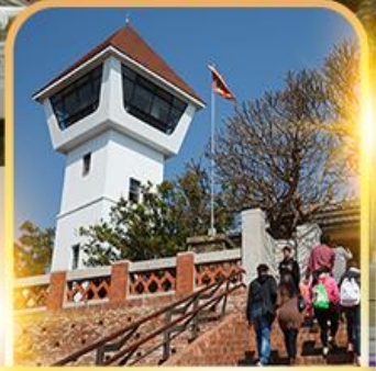
ถนนเก่าโบราณอันผิง