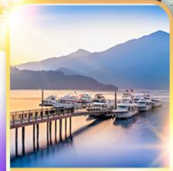
ทะเลสาบสุริยอันตรา