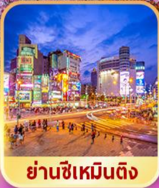
ย่านซีเหมินติง