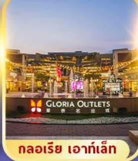
กลอรีเออท์ เล็ก