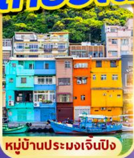
หมู่บ้านประมงเงินปิง

พักซีเหมินติง 2 คืน เที่ยวเต็ม!! ไม่มีวันอิสระ