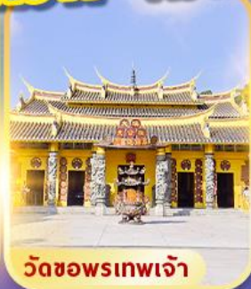
วัดซอพรเทพเจ้า