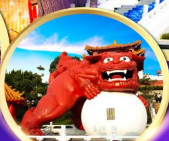
วัดเหวินหู่