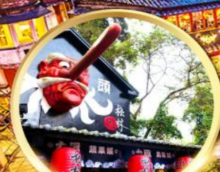
หมู่บ้านปิสางซีโกว