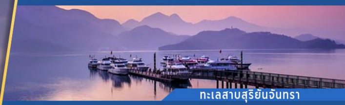
ทะเลสาบสุริยอินจันตรา