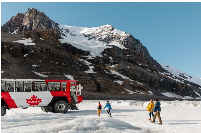
(Jasper National Park)

นำท่านเดินทางสู่ ทุ่งน้ำแข็งโคลัมเบีย (Columbia Icefield) ใช้เวลาเดินทาง ประมาณ3ชั่วโมงครึ่ง เป็นทุ่งน้ำแข็งที่ใหญ่ ที่สุดในเทือกเขาร็อกกี้ของทวีปอเมริกาเหนือ ตามแนวชายแดนของบริติชโคลัมเบียและอัล เบอร์ตา ประเทศแคนาดา ทุ่งน้ำแข็งนี้ บางส่วนอยู่ที่ปลายสุดด้านตะวันตกเฉียง เหนือของอุทยานแห่งชาติแบนฟ์ (Banff National Park) และบางส่วนอยู่ที่ปลายสุด ด้านใต้ของอุทยานแห่งชาติแจสเปอร์