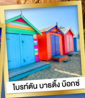
โบสถ์ต้น บาร์ตัง บ็อกซ์