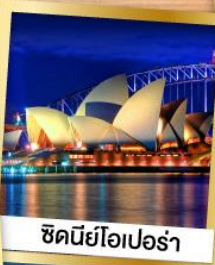
ซินีโยเปอร์รา