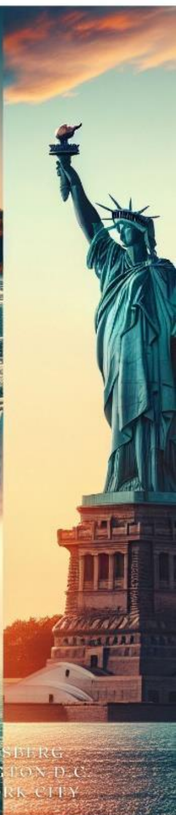
HARRISBERG WASHINGTON D.C. NEW YORK CITY