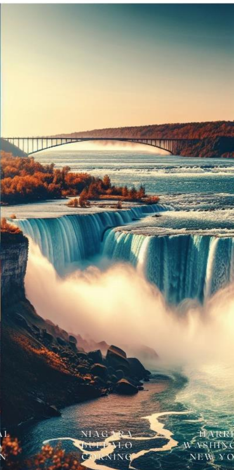
NIAGARA BUFFALO CORNING