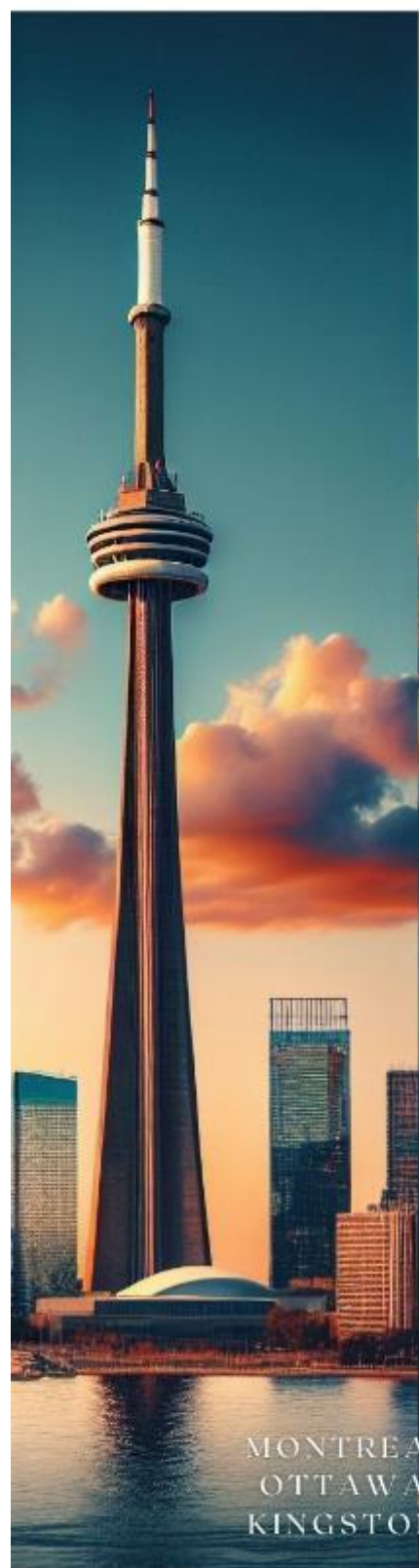
MONTREAL OTTAWA KINGSTON