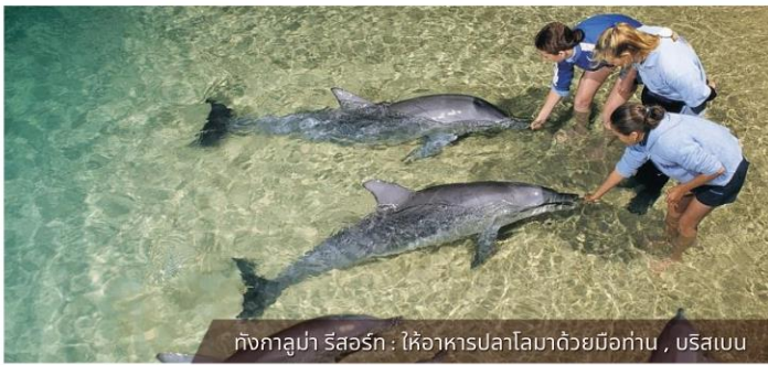
กังกาบูมา รีสอร์ท : ให้อาหารปลาโลมาด้วยมือท่าน , บริสเบน