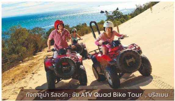
กังกาบูมา รีสอร์ท : ขับ ATV Quad Bike Tour , บริสเบน