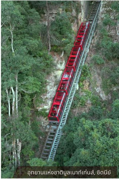
อุทยานแห่งชาติบลูเมาท์เทนส์, ซิดนีย์