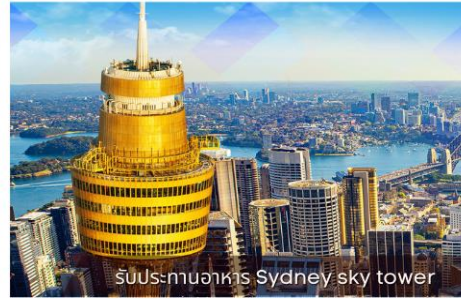
รับประทานอาหาร Sydney sky tower