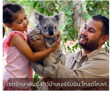
เขตรักษาพันธุ์สัตว์ป่าเคอร์ร็บบิน, โคลด์โทล์ก