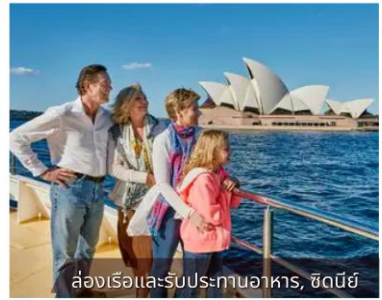
ล่องเรือและรับประทานอาหาร, ซิดนีย์