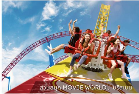
สวนสนุก MOVIE WORLD , บริสเบน