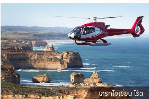
เกรทโอเชียน ไรด์