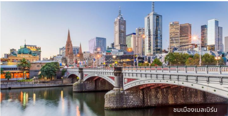
ชมเมืองเมลเบิร์น