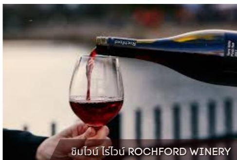
ชิมไวน์ ไร่ไวน์ ROCHFORD WINERY