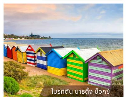
ไบรด์ตัน บาร์ติง บ็อกซ์