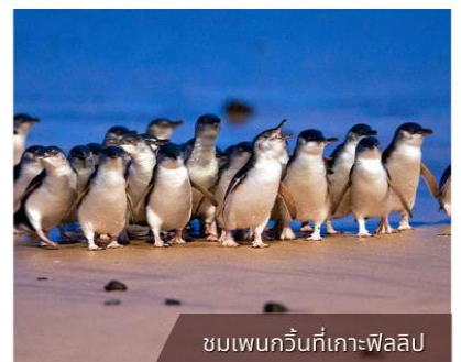
ชมเพนกวินที่เกาะฟิลลิป