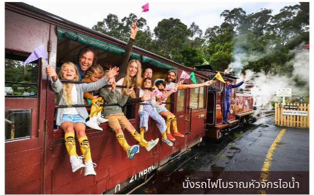
นั่งรถไฟโบราณหิวจักรไอน้ำ