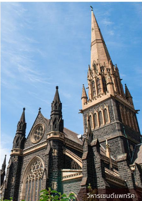
วิหารเซนต์แพทริก