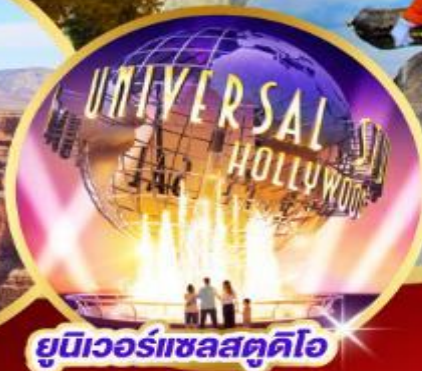
ยูนิเวอร์แซลสตูดิโอ