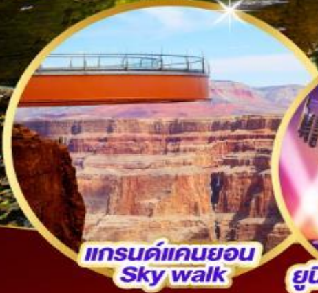
แกรนด์แคนยอน Sky walk