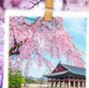
วังเคียงบกกุง