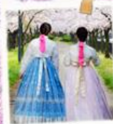
ใส่ชุดฮันบก