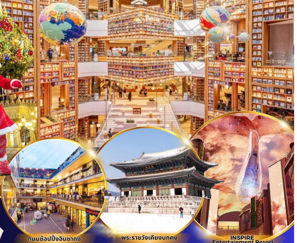
ถนนช้อปปิ้งอินชาง

ใหม่!! ห้องสมุดสุดอลังการที่ชวอน ชมจอ LED เสมือนจริงขนาดยักษ์ สนุกสุดมันส์ที่สวนสนุกเอเวอร์แลนด์ ชมพระราชวังเคียงบกกุง ถนนวัฒนธรรมอินชาง อิสระช้อปปิ้งคังนัม เมียงดง Lotte Duty Free