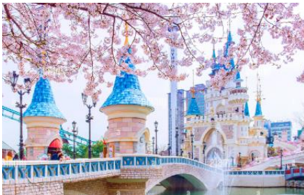
ตลอดเวลาด้านในสวนสนุกแห่งนี้

หมู่บ้านบุกซอนอันอก หมู่บ้านโบราณตั้งแต่สมัยราชวงศ์โชซอน ที่ยังคงสถาปัตยกรรมแบบดั้งเดิม มองไปทางไหนก็เจอแต่บ้านทรงโบราณเหมือนที่เราเห็นในซีรีส์ ทำให้มีนักท่องเที่ยวและวัยรุ่นเกาหลีชอบเช่าชุดฮันบกมาถ่ายรูปที่นี่ จุดถ่ายรูปยอดฮิตในหมู่บ้านก็คือบริเวณเนินที่มองเห็นหอคอยโซลทาวเวอร์ รวมถึงยังมีบางส่วนของเปิดเป็นร้านอาหาร คาเฟ่ และเกสต์เฮาส์อีกด้วย