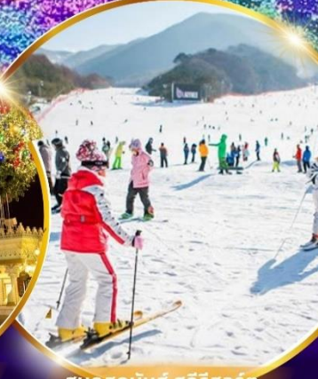
สนุกสุดมันส์ สกีรีสอร์ท

ชมจอ LED ขนาดยักษ์ที่รีสอร์ท 5 ดาว ใหญ่ที่สุดในเอเชียเหนือ สัมปัสหิมะสกีรีสอร์ท สนุกสุดมันส์ สวนสนุกเอเวอร์แลนด์ ชมพระราชวังคยองบกคุง ย้อนอดีตหมู่บ้านบุกซอน อันอก อิสระช้อปปิ้งคังนัม Lotte Duty Free