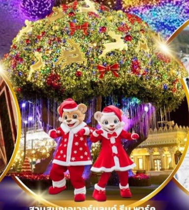
สวนสนุกเอเวอร์แลนด์ ฮิม พาร์ค