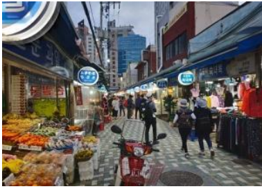
กับชายหาด Haeundae

ตลาดแฮอุนแด เป็นถนนเล็กๆ ที่มีร้านอาหารเปิดขายกันตั้งแต่เช้าเรื่อยไปจนถึงเที่ยงคืน ปัจจุบันย่านตลาดแฮอุนแด มีการก่อสร้างถนน และอาคารใหม่ๆ เกิดขึ้นมากมายเพื่อรองรับนักท่องเที่ยวจากทั่วโลก เรียกว่ายิ่งตึก ยิ่งคึกคัก ถึงแม้ว่า ความเจริญจะรายล้อมเข้ามามากมาย แต่ความน่าสนใจของ ตลาดแบบดั้งเดิม ตลาด Haeundae Traditional Market ก็ยังมีเสน่ห์มาจนถึงทุกวันนี้ อาหารแนะนำ ของทอด ไอ้แดงเสียบไม้ ข้าวห่อสาหร่าย และต็อกโบกิ เป็นถนนสายอาหารแบบดั้งเดิมที่อยู่คู่