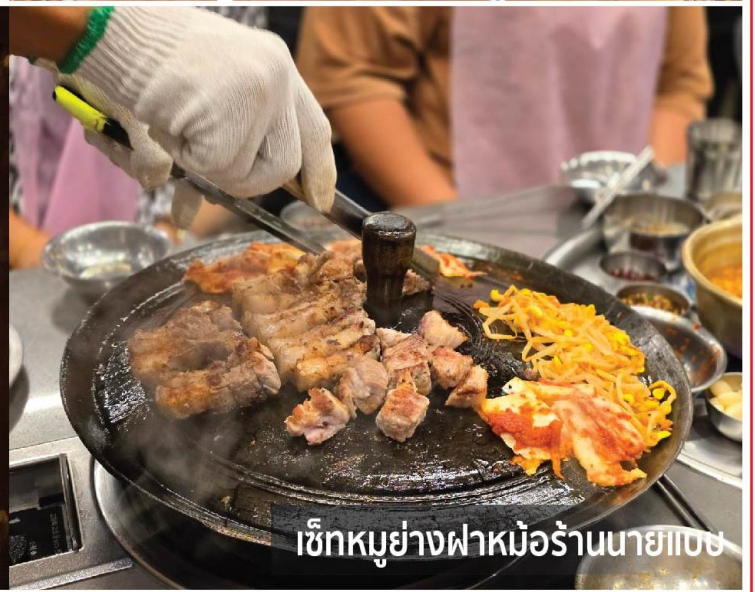
เช็กหมูย่างฟาหม้อร้านนายาซอง