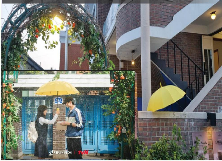
ตามรอย 1 ซีรีส์ชื่อดัง Lovely Runner Mongted Coffee & Dessert