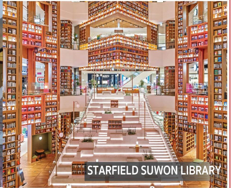
STARFIELD SUWON LIBRARY