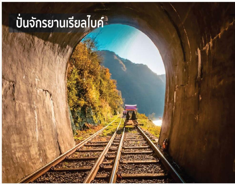
ปั่นจักรยานเรียลไบค์