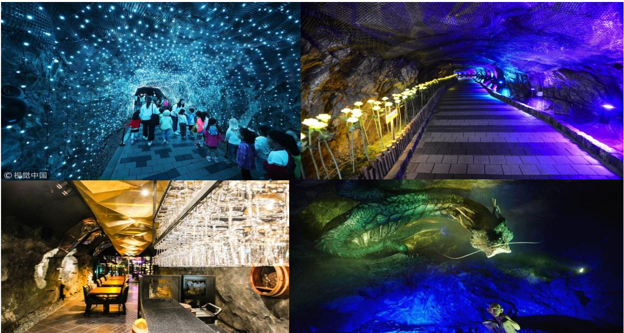
อาหารเย็น (2)

จากนั้นนำท่านเข้าชม ถ้ำควังเมียง สถานที่ท่องเที่ยวทางประวัติศาสตร์ ตั้งอยู่ที่เมืองควางมยอง กำเนิดขึ้นเมื่อปี 1912 และเคยเป็นเหมืองขุดทองที่ใหญ่มาก มาตั้งแต่สมัยที่เกาหลีอยู่ใต้อาณานิคมของญี่ปุ่น ก่อนจะถูกปล่อยทิ้งร้างในปี 1972 ยาวนานกว่า 40 ปี ปัจจุบัน รัฐบาลได้ทำการรีโนเวทถ้ำแห่งนี้ใหม่ทั้งหมด โดยปรับเปลี่ยนให้เป็นมิวเซียม และ อาร์ตแกลเลอรี ตลอดทางเดินภายในถ้ำที่ยาวประมาณ 7.8 กิโลเมตร ประดับประดาไปด้วยแสงไฟ LED หลากหลายสี มีการเล่นที่สีกกราฟฟิตีบนผนังถ้ำเป็นลวดลายที่วิจิตรสวยงาม และแบ่งห้องจัดแสดงออกเป็นหลายๆ ห้อง อีกทั้งยังมีห้องจัดแสดงไวน์ ซึ่งคุณสามารถชิมและเลือกซื้อไวน์คุณภาพดีจากที่นี่ได้ ตลอดจนมีห้องโถงสำหรับการแสดงดนตรี หรือใช้เป็นโรงละคร ที่มีเก้าอี้ให้คุณนั่งชมในถ้ำได้ด้วย นอกจากนี้หากคุณติดตามภาพยนตร์เรื่อง The Hobbit และเป็นแฟนตัวยงของ The Lord of the Rings คุณอาจชื่นชอบประติมากรรมตัวละคร “กอลลัม” ที่ส่งตรงมาจากผู้กำกับของเรื่องเลยที่เดียว