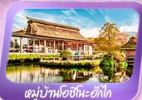
หมู่บ้านโอชิโนะอัทไก

สัมผัสความงดงามของภูเขาไฟฟูจิ ที่พิพิธภัณฑ์ฟูจิ เวิร์ลเฮอริเทจเซ็นเตอร์ ศาลเจ้าฟูจิซังเซ็นเก็น วัดอาซากุสะ หมู่บ้านโอชิโนะอัทไก ชมวิวสุดตระการตาที่ทะเลสาบยามานาโกะ สวนโออิชิ ซอปปิงโอโดบะห้างไดเวอร์ซิตี