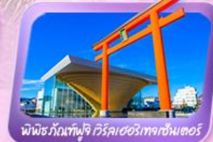
พิพิธภัณฑ์ฟูจิ เวิร์ลเฮอริเทจเซ็นเตอร์