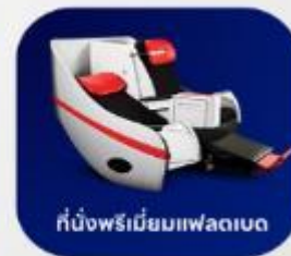
ที่นั่งพรีเมียมเฟลทอป