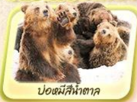
ปอดมีสีน้ำตาล