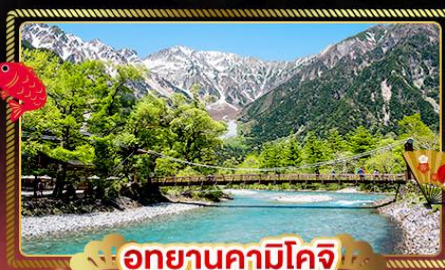
อุทยานคามิโคจิ