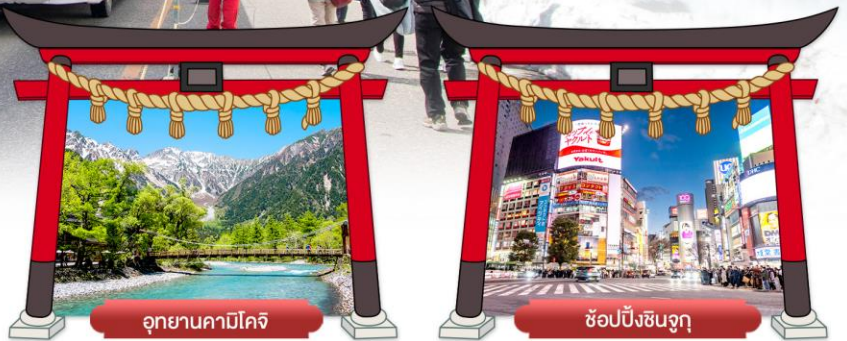
อุทยานคามิโคจิ