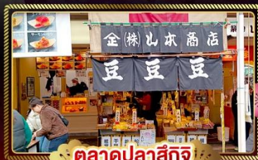
ตลาดปลาสึกิจิ