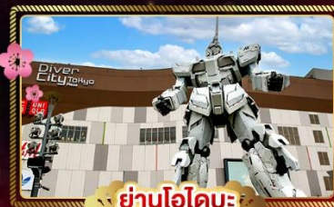
ย่านโอไดบะ