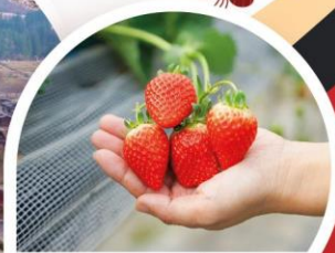
เก็บสตอร์เบอร์รี่