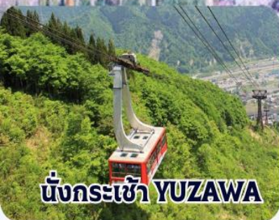
นั่งกระเช้า YUZAWA