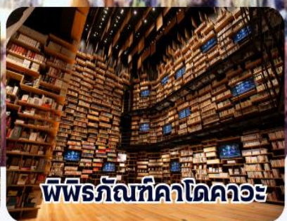
พิพิธภัณฑ์คาเคะ