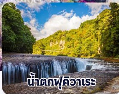
น้ำตกฟูจิอาระ