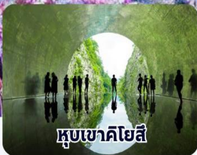
หุบเขาคิโยสึ