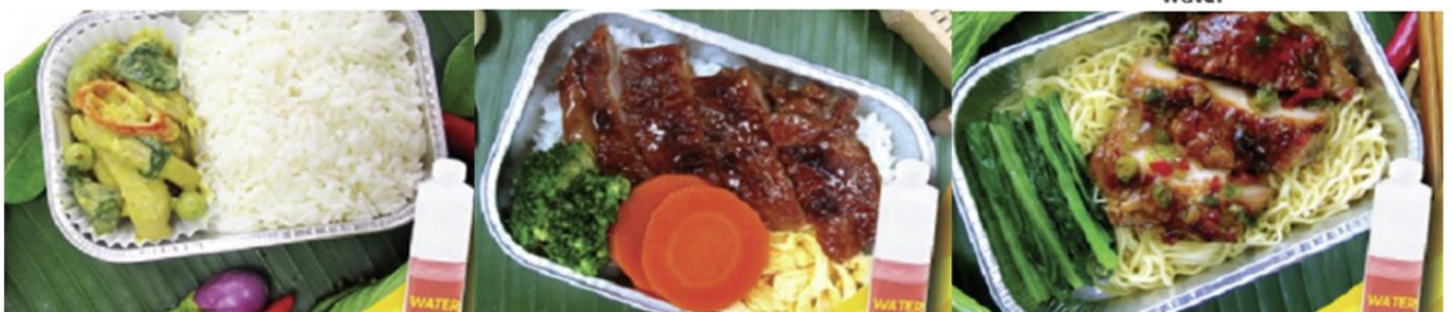
Chicken roasted with herb and noodle and water