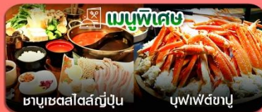
เมนูพิเศษ ชาบูซอสสไตล์ญี่ปุ่น