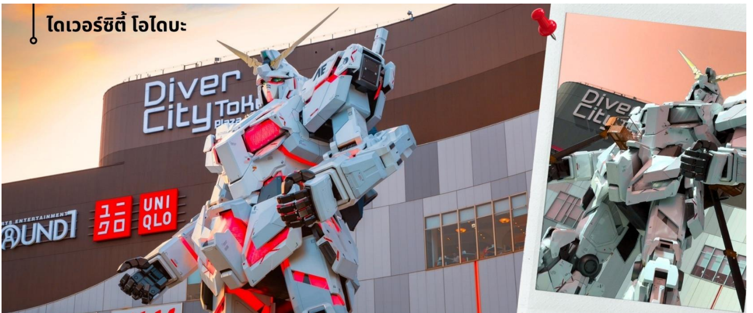
โตเวอร์ซิตี โอโตบะ

หลังจากนั้นพาท่านแวะพิพิธภัณฑ์แผ่นดินไหว เป็นพิพิธภัณฑ์ที่แสดงถึงผลกระทบจากภัยพิบัติแผ่นดินไหวและการระเบิดของภูเขาไฟ ภายในพิพิธภัณฑ์มีห้องจัดแสดงข้อมูลการประทุของภูเขาไฟจากทุกมุมโลก โชนความรู้ต่างๆและ โชนข้อปึงสินค้าญี่ปุ่นอาทิเช่น ผลิตภัณฑ์เครื่องสำอางและของฝากอีกมากมาย นำท่านเดินทางสู่ โตเวอร์ซิตี โอโตบะ Diver City Plaza เป็นเกาะจำลองขนาดใหญ่ ซึ่งสร้างขึ้นจากการถมทะเลบริเวณอ่าวโตเกียว เติบโตขึ้นอย่างรวดเร็วในฐานะเขตท่าเรือจนถึงช่วงทศวรรษที่ 1990 โอโตบะ ได้กลายเป็นย่านการค้ามีห้างสรรพสินค้าขนาดใหญ่ที่พักอาศัยและแหล่งนันทนาการที่ใหญ่โตแห่งหนึ่งให้ท่านได้ชม Unicorn Gundam หุ่นกันดั้มตัวใหม่เป็นรุ่น RX-0 Unicorn Gundam ในโหมด Destroy เป็น หุ่นสีขาว-แดงมีความสูงประมาณ 24 เมตรสูงกว่าหุ่นตัวเดิมถึง 6 เมตร และข้อปึงตามอัยาศัย