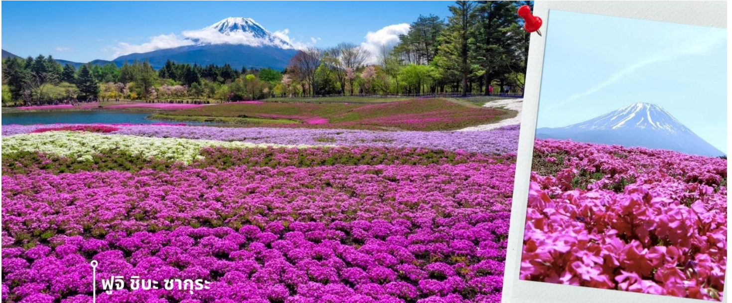
ฟูจิ ชิบะ ซากุระ

หลังรับประทานอาหารเช้าก็นำท่านเดินทางสู่ งานเทศกาลชมดอกชิบะซากุระ ที่สามารถมองเห็นทุ่งดอกไม้สีชมพูสดไส พร้อมกับฉากหลังภูเขาไฟฟูจิ เรียกได้ว่าเป็นแหล่งท่องเที่ยวที่ผู้คนแห่กันมาชมความงาม ดอกชิบะซากุระ หรือดอก phlox มีชื่อเรียกหลายชื่อเช่น creeping phlox, moss phlox, moss pink หรือ mountain phlox และมีหลายเฉดสี ตั้งแต่สีม่วง สีฟ้า สีขาว และสีชมพู ถึงแม้ว่าชื่อของดอกไม้นี้จะเรียกว่า ชิบะซากุระ แต่ดอกไม้ชนิดนี้เป็นคนละสายพันธุ์กับดอกซากุระปกติ โดยดอกชิบะซากุระ จะมีชื่อเรียกอีกชื่อว่า ฟิงค์มอส (Pink Moss) มีถิ่นกำเนิดมาจากอเมริกาเหนือ เป็นพืชตระกูลมอส ที่เติบโตขึ้นตามพื้นดิน ดอกมีขนาดเล็ก และกลีบดอกมีลักษณะคล้ายกับดอกซากุระ หากดอกไม้บานเต็มที่ พื้นดินจะดูเหมือนปูพรมด้วยสีแสนสดใสหลากหลายเฉดสี ให้ความสวยงาม เทศกาลดอกไม้ไม่มีขึ้นทุกปีในช่วงประมาณกลางเดือนเมษายนเป็นต้นไป ทั้งนี้ขึ้นอยู่กับสภาพอากาศในแต่ละปีด้วย ให้ท่านได้ชมทุ่งดอกไม้สีชมพูแผ่กระจายไปสู่ดสายตากับฉากหลังแสนสวย