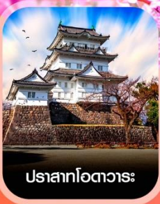
ปราสาทโอตาวาระ