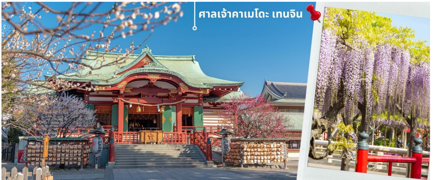
ศาลเจ้าคาเมโดะ เทนจิน

หลังจากนั้นจากนั้นนำท่านเดินทางสักการะ ขอพรกันที่ ศาลเจ้าคาเมโดะ เทนจิน Kameido Tenjin Shrine เป็นศาลเจ้าที่ตั้งอยู่เมืองโตเกียว ศาลเจ้าแห่งนี้สร้างขึ้นกว่า 350 ปี เพื่ออุทิศให้แก่นักปราชญ์ชื่อดังของญี่ปุ่นสุกาวะระโนะ มิชิซานะ ศาลเจ้าแห่งนี้ขึ้นชื่อว่าเป็นสถานที่ยอดนิยมสำหรับนักท่องเที่ยวทั้งต่างชาติและนักท่องเที่ยวชาวญี่ปุ่น เนื่องจากเป็นสถานที่สำคัญในไหว้ขอพรเพื่อความเป็นสิริมงคลแล้ว รวมถึงเรียนรู้ประวัติศาสตร์ผ่านศิลปะแล้วนั้น ภายในศาลเจ้าแห่งนี้ยังมีทิวทัศน์ทางธรรมชาติที่สวยงามของดอกวิสทีเรีย ที่มีความโดดเด่นที่สะพานโค้งสีแดงกลางสระน้ำ สำหรับชาวญี่ปุ่น ดอกวิสทีเรีย(Wisteria) เป็นดอกไม้สำคัญอีกชนิดหนึ่งรองจากซากุระ โดยจะออกดอกสีม่วง