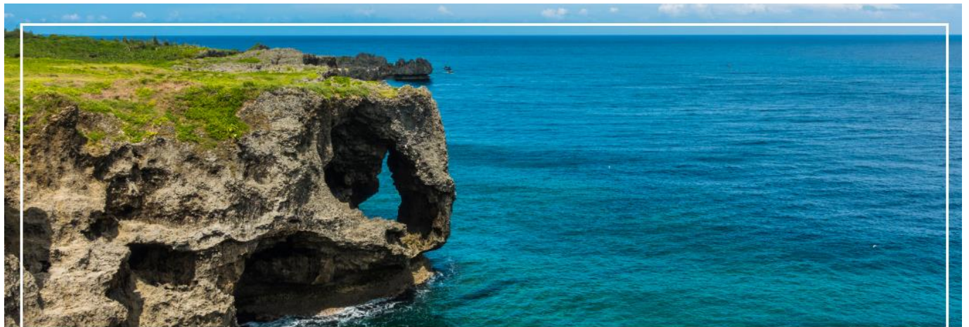
CAPE MANZAMO ผามันซาโมะ

เที่ยง รับประทานอาหารกลางวัน ณ ภัตตาคาร (2)