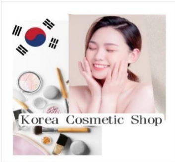
มาซื้อถึงศูนย์โดยตรง

จากนั้นพาท่านเดินทางสู่ ร้านรวมเครื่องสำอาง (COSMETIC SHOP)เอาใจคนรักผิว ชม ศูนย์เครื่องสำอางประเภทเวชสำอางที่มอศัลยกรรมเกาหลีร่วมออกแบบมากมาย มี ผลิตภัณฑ์ต่างๆ ที่เหมาะกับผู้ที่ปัญหาผิวหน้า ไม่ว่าจะเป็นสิว มีริ้วรอย ฝ้า กระ จุดด่างดำ ใบหน้าหมองคล้ำ จบครบทุกปัญหาผิว ถือเป็นนวัตกรรมความงามที่ไม่ต้องเจ็บตัวก็สามารถมีผิวสวย ใส เงาม วาว แบบหนุ่ม/สาวเกาหลี ด้วยผลิตภัณฑ์ที่มาจากธรรมชาติ ไร้สารเคมี ปลอดภัย และเหมาะกับผิวคนไทย คนเอเชียโดยเฉพาะ ที่สำคัญราคาไม่แพงเพราะ