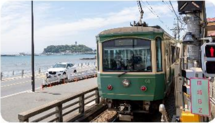
เมืองคามาคุระ