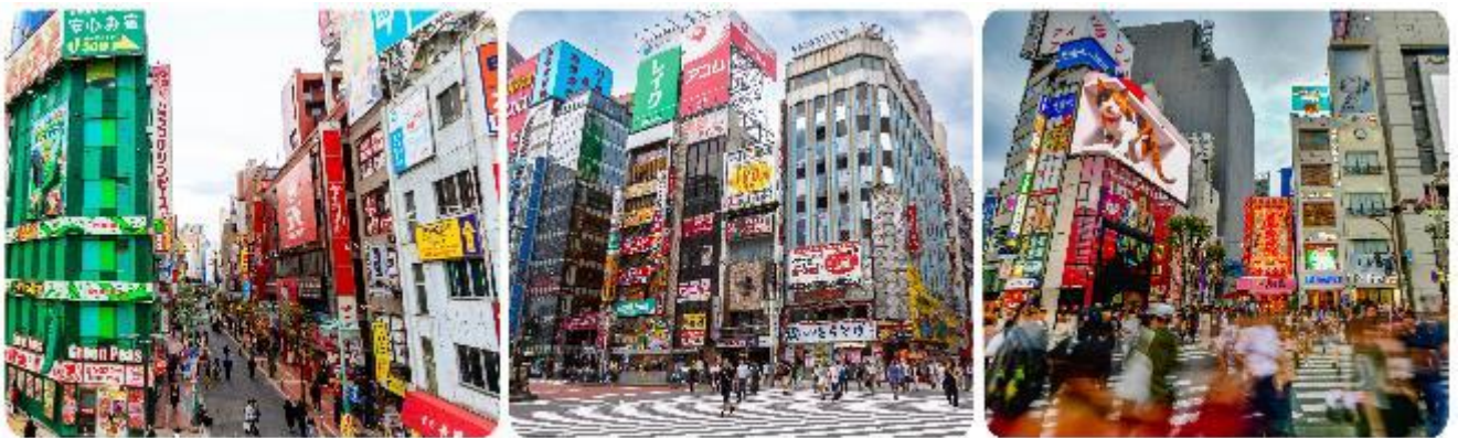
ช้อปปิ้งใจกลางกรุงโตเกียว - ชินจุกุ

มื้อกลางวัน บริการท่านด้วย ชุดอาหารญี่ปุ่นเบนโตะ