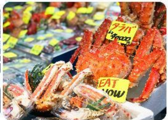
ตลาดปลาซึกิจิ

แนะนำที่เกี่ยวข้อง อิสระด้วยตัวเอง - ตลาดปลาซึกิจิ Tsukiji Outer Market ตลาดปลาชื่อมีชื่อเสียงของญี่ปุ่น และยังเป็นหนึ่งในตลาดปลาที่ใหญ่ที่สุดในโลกด้วยค่ะ ตั้งอยู่ในโตเกียว ตลาดแห่งนี้มีการซื้อขายอาหารทะเลมากกว่า 2,000 ตันต่อวัน โดยโซนภายในตลาดนั้นจะแบ่งออกเป็น 2 ส่วน ก็คือ ส่วนด้านนอก ที่มีร้านค้าปลีกและร้านอาหารอยู่เรียงรายให้เราได้เลือกซื้ออาหารทะเลสด ๆ รับประทานกัน