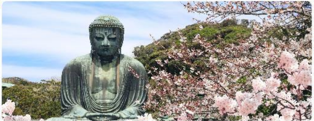
พระใหญ่ไดบุทสึ วัดโคโตคุอิน

จุดเด่นแห่งเมืองนี้คือ พระพุทธรูปองค์ใหญ่ไดบุทสึ (Daibutsu) หนึ่งในสัญลักษณ์ที่โดดเด่นที่สุดของ Kamakura พระพุทธรูปบรอนซ์ขนาดมหึมาที่วัดโคโตคุอิน (Kotoku-in) ที่มีความสูง 13.35 เมตร หนึ่งในพระพุทธรูปที่ใหญ่ที่สุดในญี่ปุ่น ไฮไลท์ของที่นี่คือการได้ชมความงามที่ตัดกันระหว่างพระพุทธรูปไดบุทสึขนาดใหญ่และต้นซากุระ ซึ่งปลูกอยู่ทั้งด้านหน้าและด้านหลังของพระพุทธรูป ทำให้เหมาะอย่างยิ่งกับการเดินเล่นและชมซากุระในบริเวณวัด เป็นอีกหนึ่งสถานที่ที่ต้องมาเยือนสักครั้ง หนึ่งในจุดไฮไลท์ของเมืองคามาคุระ คือ ไมโกะกันพาเอิน เกาะเอโนะชิมะ (Enoshima) เป็นเกาะที่ตั้งอยู่ในจังหวัดคานากาวะ ประเทศญี่ปุ่น ซึ่งเป็นจุดหมายท่องเที่ยวยอดนิยมที่มีทิวทัศน์สวยงามและสถานที่ที่น่าสนใจมากมาย ทั้งชายหาด สวน และวิหะเลที่งดงาม ในวันที่ท้องฟ้าโปร่งใสเรายังสามารถมองเห็นวิวของภูเขาไฟฟูจิได้อีกด้วย ด้านบนยังมี ศาลเจ้าเอโนชิมะ ที่มีความสำคัญในด้านความโชคดี โดยเฉพาะในเรื่องความรัก นอกจากนี้ยังมี หอคอยประภาคารเอโนชิมะ ที่ให้ทัศนียภาพ 360 องศา ของเมืองคามาคุระได้อีกด้วย