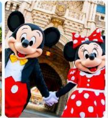
โตเกียวดิสนีย์แลนด์

แนะนำที่เที่ยว อิสระด้วยตัวเองเต็มวัน ! เลือกซื้อทัวร์เสริมอิสระดิสนีย์แลนด์ (ไม่มีหัวหน้าทัวร์และไม่มีไกด์นำเที่ยว) เอาใจแฟนพันธุ์แท้ของดิสนีย์ กับ สวนสนุกโตเกียวดิสนีย์แลนด์ ที่เต็มไปด้วยการผจญภัย ความสนุกสนานในโลกแฟนตาซีเมื่อเดินทางเข้าสู่ สวนสนุกโตเกียวดิสนีย์แลนด์ จะพบกับธีมพาร์คที่ แบ่งออกเป็น หลากหลาย เช่น Adventureland ที่เต็มไปด้วยการผจญภัยในป่าและน้ำตก, Fantasyland ดินแดนของตัวละครดิสนีย์ที่คุณหลงใหล, และ Tomorrowland ที่จะพาคุณไปสำรวจอนาคตที่เต็มไปด้วยนวัตกรรม และเปิดประสบการณ์ใหม่ที่ Tokyo Disney Sea ที่จะพาคุณไปผจญภัยยังโลกทะเลและการผจญภัยทางน้ำ นอกจากนี้เรายังเพลิดเพลินกับร้านอาหารและคาเฟ่รวมถึงของฝากจากดิสนีย์ อีกมาย (ค่าทัวร์ยังไม่รวมบัตรค่าเข้า)