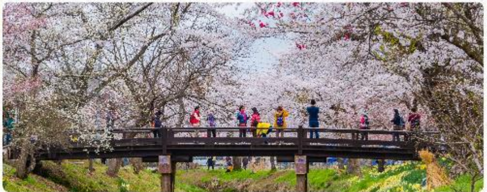
หมู่บ้านน้ำใสโอชิโนะ ฮักโก

โอชิโนะ ฮักโก หรือ ที่รู้จักกันในชื่อ หมู่บ้านน้ำใส ความงามแห่งธรรมชาติและวัฒนธรรมที่ซ่อนอยู่ใต้เงากุเอาไฟฟูจิโอชิโนะ ฮักโก ตั้งอยู่ในหมู่บ้านโอชิโนะ จังหวัดยามานาชิ ประเทศญี่ปุ่น เป็นแหล่งน้ำธรรมชาติที่มีชื่อเสียง ประกอบด้วยบ่อน้ำใสสะอาดทั้งแปดแห่ง ซึ่งน้ำในบ่อเหล่านี้เกิดจากการละลายของหิมะและน้ำแข็งจากกุเอาไฟฟูจิ น้ำที่ไหลลงมานั้นได้ถูกกรองผ่านชั้นหินภูเขาไฟเป็นเวลาหลายปี จนทำให้น้ำในบ่อมีความบริสุทธิ์และใสจนเห็นถึงก้นบ่อ ไม่เพียงแต่ความงามของธรรมชาติที่ทำให้โอชิโนะ ฮักโก