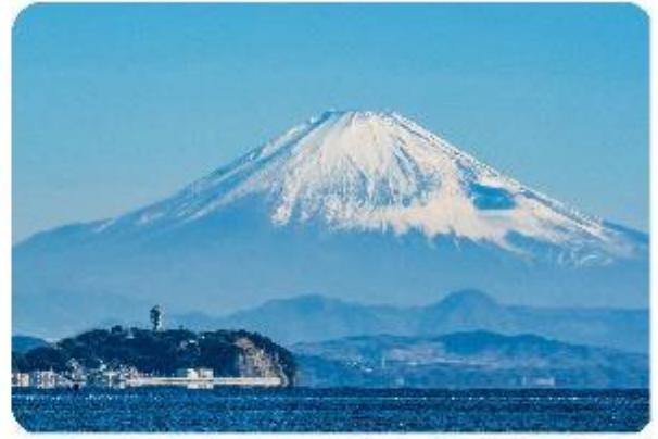
เกาะเอโนะชิมะ

เมืองคามาคุระ (Kamakura) เมืองน่ารักติดทะเล ตอบใจพท์ที่เกี่ยวที่ผสมผสานระหว่างประวัติศาสตร์ ธรรมชาติ และความงามของทะเล บอกเลยใครมาต้องตกหลุมรักกับเมืองสุดชิล อย่าง คามาคุระ เมืองเล็กๆ ที่ตั้งอยู่ทางตอนใต้ของจังหวัดคานากาวะ ห่างจากโตเกียวเพียงแค่ 1 ชั่วโมง เท่านั้น แต่เต็มไปด้วยสถานที่ท่องเที่ยว ทิวทัศน์ธรรมชาติ และชายหาดที่งดงาม ที่นี่จะทำให้ทุกคนรู้สึกเหมือนได้ย้อนกลับไปสัมผัสประวัติศาสตร์ญี่ปุ่น ในยุคซามูไร พร้อมทั้งได้ผ่อนคลายท่ามกลางบรรยากาศที่เงียบสงบและสดชื่น