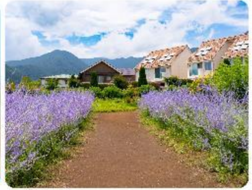
สวนโออิชิ ปาร์ค

สวนดอกไม้โออิชิ พาร์ค (Oishi Park) มหัศจรรย์แห่งวิวกุเอาไฟฟูจิ หนึ่งในจุดชมวิวของกุเอาไฟฟูจิที่สวยงามที่สุดอีกจุดหนึ่ง ที่จะเติมเต็มความสงบและความงดงามของธรรมชาติในญี่ปุ่นเมื่อไปเยือน คือสถานที่ที่ไม่ควรพลาด สวนดอกไม้โออิชิ พาร์ค (Oishi Park) แห่งนี้ไม่ได้เป็นเพียงสถานที่ที่มีดอกไม้สวยงามมาให้เราได้ชื่นชมแล้ว จุดเด่นของสวนนี้คือวิวกุเอาฟูจิที่อยู่เบื้องหลังสวนดอกไม้สีแสนสดใส ที่บานสะพรั่งในทุกฤดูกาล และยังเป็นมุมที่ให้เราได้สัมผัสกับวิวกุเอาฟูจิได้อย่างใกล้ชิด จากนั้นนำพาทุกท่านสู่..