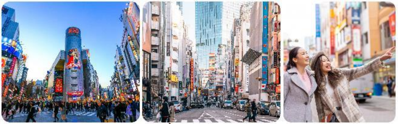
ช้อปปิ้งใจกลางกรุงโตเกียว