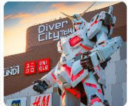
ย่านโอไดบะ: ห้างไดเวอร์ซิตี ODAIBA SEASIDE PARK