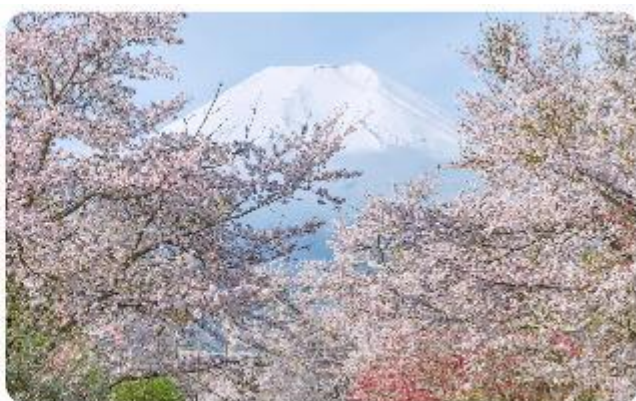
หมู่บ้านน้ำใสโอชิโนะ ฮักโก

โอชิโนะ ฮักโก หรือ ที่รู้จักกันในชื่อ หมู่บ้านน้ำใส ความงามแห่งธรรมชาติและวัฒนธรรมที่ซ่อนอยู่ใต้เงาภูเขาไฟฟูจิโอชิโนะ ฮักโก ตั้งอยู่ในหมู่บ้านโอชิโนะ จังหวัดยามานาชิ ประเทศญี่ปุ่น เป็นแหล่งน้ำธรรมชาติที่มีชื่อเสียง ประกอบด้วยบ่อน้ำใสสะอาดทั้งแปดแห่ง ซึ่งน้ำในบ่อเหล่านี้เกิดจากการละลายของหิมะและน้ำแข็งจากภูเขาไฟฟูจิ น้ำที่ไหลลงมานั้นได้ถูกกรองผ่านชั้นหินภูเขาไฟเป็นเวลาหลายปี จนทำให้น้ำในบ่อมีความบริสุทธิ์และใสจนเห็นถึงก้นบ่อ ไม่เพียงแต่ความงามของธรรมชาติที่ทำให้โอชิโนะ ฮักโก