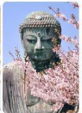
พระใหญ่ไดบุทสึ วัดโคโตคุอิน

จุดเด่นแห่งเมืองนี้คือ พระพุทธรูปองค์ใหญ่ไดบุทสึ (Daibutsu) หนึ่งในสัญลักษณ์ที่โดดเด่นที่สุดของ Kamakura พระพุทธรูปบรอนซ์ขนาดมหึมาที่วัดโคโตคุอิน (Kotoku-in) ที่มีความสูง 13.35 เมตร หนึ่งในพระพุทธรูปที่ใหญ่ที่สุดในญี่ปุ่น ไฮไลท์ของที่นี่คือการได้ชมความงามที่ตัดกันระหว่างพระพุทธรูปไดบุทสึขนาดใหญ่และต้นซากุระ ซึ่งปลูกอยู่ทั้งด้านหน้าและด้านหลังของพระพุทธรูป ทำให้เหมาะอย่างยิ่งกับการเดินเล่นและชมซากุระในบริเวณวัด เป็นอีกหนึ่งสถานที่ที่ต้องมาเยือนสักครั้ง หนึ่งในจุดไฮไลท์ของเมืองคามาคุระ คือ ไมโกลกันพาเอียน เกาะเอโนชิมะ (Enoshima) เป็นเกาะที่ตั้งอยู่ในจังหวัดคานากาวะ ประเทศญี่ปุ่น ซึ่งเป็นจุดหมายท่องเที่ยวยอดนิยมที่มีทิวทัศน์สวยงามและสถานที่ที่น่าสนใจมากมาย ทั้งชายหาด สวน และวิวทะเลที่งดงาม ในวันที่ท้องฟ้าโปร่งใสเรายังสามารถมองเห็นวิวของภูเขาไฟฟูจิได้อีกด้วย ด้านบนยังมี ศาลเจ้าเอโนชิมะ ที่มีความสำคัญในด้านความโชคดี โดยเฉพาะในเรื่องความรัก นอกจากนี้ยังมี หอคอยประภาคารเอโนชิมะ ที่ให้ทัศนียภาพ 360 องศา ของเมืองคามาคุระได้อีกด้วย