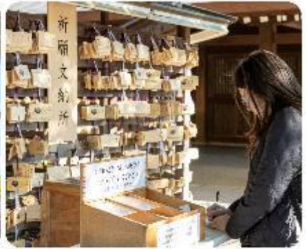
ศาลเจ้าเมจิจิงกู

ศาลเจ้าเมจิ หนึ่งในสถานที่อันศักดิ์สิทธิ์ใจกลางกรุงโตเกียว สิ่งแรกที่จะทำให้คุณประทับใจคือการเดินผ่านเสาโทริอิขนาดใหญ่ ระหว่างทางมีธรรมชาติที่ทำให้รู้สึกเหมือนก้าวเข้าสู่อีกโลกหนึ่งที่ได้เต็มไปด้วยความสงบ อีกทั้งยังสามารถเขียนคำอธิษฐานลงบนแผ่นไม้ "เอมะ" เพื่อขอพรสำหรับความสุขและความสำเร็จในชีวิตอีกด้วย จากนั้นนำพาทุกท่าน...ช็อปปิ้งกันต่อใจกลางกรุงโตเกียว เมืองที่เป็นศูนย์กลางของแฟชั่นและนวัตกรรม และเปิดประสบการณ์การช็อปปิ้งที่ไม่เหมือนใคร! สัรวจย่านต่างๆ ที่แต่ละแห่งที่มีเสน่ห์และเอกลักษณ์อันโดดเด่น เมืองที่เต็มไปด้วยชีวิตชีวาและความทันสมัยที่หลากหลายอย่าง ย่านฮาราจุกุ แหล่งรวมแฟชั่นที่แปลกใหม่และสดใส เดินเล่นบน Takeshita Street ที่ได้ไปด้วยเสื้อผ้าและเครื่องประดับที่ไม่ซ้ำใคร เพลิดเพลินกับบรรยากาศสุดคูลที่เป็นเอกลักษณ์