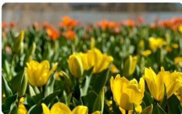
สวนโออิชิ ปาร์ค

สวนดอกไม้โออิชิ พาร์ค (Oishi Park) มหัศจรรย์แห่งวิวกุเขาไฟฟูจิ หนึ่งในจุดชมวิวของภูเขาไฟฟูจิที่สวยงามที่สุดอีกจุดหนึ่ง ที่จะเติมเต็มความสงบและความงดงามของธรรมชาติในญี่ปุ่นเมื่อไปเยือน คือสถานที่ที่ไม่ควรพลาด สวนดอกไม้โออิชิ พาร์ค (Oishi Park) แห่งนี้ไม่ได้เป็นเพียงสถานที่ที่มีดอกไม้สวยงามให้เราได้ชื่นชมแล้ว จุดเด่นของสวนนี้คือวิวกุเขาฟูจิที่อยู่เบื้องหลังสวนดอกไม้สีแสนสดใส ที่บานสะพรั่งในทุกฤดูกาล และยังเป็นมุมที่ให้เราได้สัมผัสกับวิวกุเขาฟูจิได้อย่างใกล้ชิด จากนั้นนำพาทุกท่านสู่..