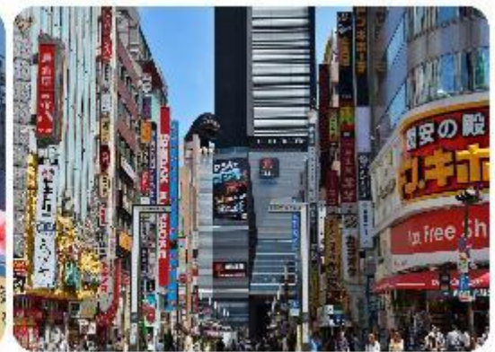
ช้อปปิ้งใจกลางกรุงโตเกียว - ซินจูกุ

นำพาทุกท่านเข้าสู่.. กรุงโตเกียว และช้อปปิ้งกันที่ใจกลางเมือง ซินจูกุ แหล่งรวมแฟชั่นและความบันเทิงย่านที่ไม่เคยหลับไหลและเต็มไปด้วยชีวิตชีวา และแหล่งช้อปปิ้งที่หลากหลาย เช่น Isetan และ Takashimaya ที่มีสินค้าหรูหราและแฟชั่นล่าสุด รวมถึงห้างสรรพสินค้าในตึกสูงอย่าง Tokyo Metropolitan Building เพลิดเพลินกับบรรยากาศที่สว่างไสวของ Kabukicho ซึ่งเป็นย่านบันเทิงที่มีร้านอาหารมากมาย นอกจากนี้ยังมี Golden Gai ซึ่งเป็นย่านบาร์เล็กๆ ที่มีเสน่ห์และบรรยากาศที่เป็นเอกลักษณ์ และมีแลนด์มาร์คถ่ายรูปที่โด่งดังอย่าง แมวยักษ์ 3 มิติ (Giant 3D Cat)