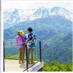
ฮาคุบะอิวาตาคะ