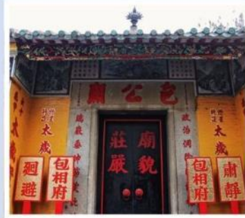
วัดเปากง