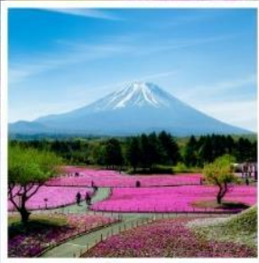
ทุ่งพืชมอส