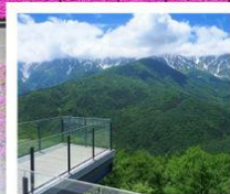
ฮาคุบะ ฮิวาตาคะ

นั้งกระเช้าฮาคุบะ: ฮิวาตาคะ / จุดชมวิวกาโบรินาฮาคุบะ: เมากัทเทนฮาร์เบอร์ ภัตตาคารฟาสต์ฟู้ด SNOW PEAK LAND / คาบิโกจิ สะพานคัปโปะ กุงพังกิมมอส / นั้งรถไฟเอโนะเด็น / วัดฮาเซเดระ / วัดโคโตะคุอิน / ซุปปิ้งซันจุกุ วัดนาริตะ / อีออน พลาซ่า / วัดอาม่า / เจ้าแม่กวนอิมปรารภศักดิ์ของริมทะเล เซนาโต้สแควร์ / วัดเป่ากง / ถนนคนเดินไทป์ / เดอะ ลอนดอนเบอร์ / เดอะ เวเนเชียน