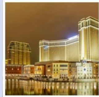
เดอะ เวเนเชียน

เทศกาลชิบะซากุระ ชมทุ่งพืชมอส ชมดอกไม้สีชมพูคู่ฟูจิ ฮาคุบะอิวาตาคะ ระเบียงกระจก จุดไฮไลท์ที่สวยงามแห่งฮาคุบะ สะพานคัปปะ ไฮไลท์แห่งหุบเขาคามิโคจิที่พลาดไม่ได้ ไม่พลาดกับของฝาก ช้อปปิ้งจุกุในชินจูกุและอิออน พลาซ่า กราบไหว้ขอพรกับเทพเจ้าองค์ไต้ส่วยเอี้ย วัดเปากง สัมผัสความอลังการของ เดอะ เวเนเชียน รีสอร์ทระดับเวิลด์คลาส พักออนเซ็น 1 คืน!!! // อาหารพิเศษ...บุฟเฟ่ต์ซาบูยักซ์, บุฟเฟ่ต์ซาบู กรุ๊ปสบายๆ เพียง 25 ท่านเท่านั้น!!!