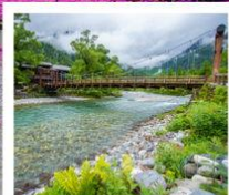
คามิโกจิ