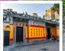
วัดเป่ากง มาเก๊า

PERIOD : 1 14 - 20 พ.ค. 68 PERIOD : 2 21 - 27 พ.ค. 68 PERIOD : 3 28 พ.ค. - 3 มิ.ย. 68