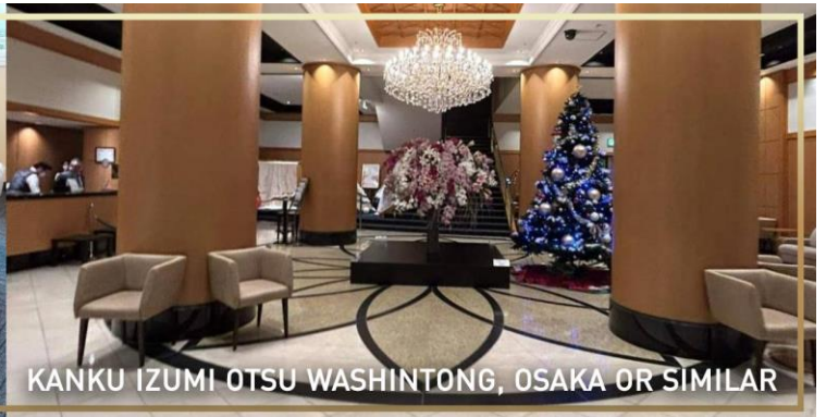
KANKU IZUMI OTSU WASHINTONG, OSAKA OR SIMILAR

วันที่ 5 สนามบินคันไซ – กรุงเทพ (ดอนเมือง)