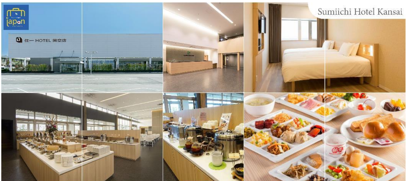
Sumiichi Hotel Kansai

พักที่ SUMIICHI HOTEL KANSAI หรือเทียบเท่าระดับเดียวกัน