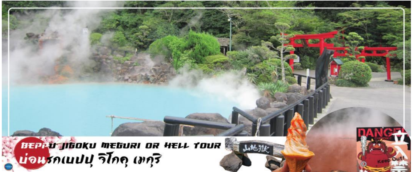
BEPPU JIGOKU MEGURI OR HELL TOUR บ่อนรกเบปปุ, จิโกคุ, เมกิริ

วันที่สาม เมืองเบปปุ – บ่อนรกเบปปุ จิโกคุ เมกิริ (เข้าชม 2 บ่อ) – เมืองยฟูอิน – หมู่บ้านยฟูอิน ทะเลสาบคิริน – เมืองฟุกุโอกะ – ศาลเจ้าตะไซฟุเหมมังกุ – ดิวตี้ฟรี – กันดั้ม ปาร์ค ฟุกุโอกะ