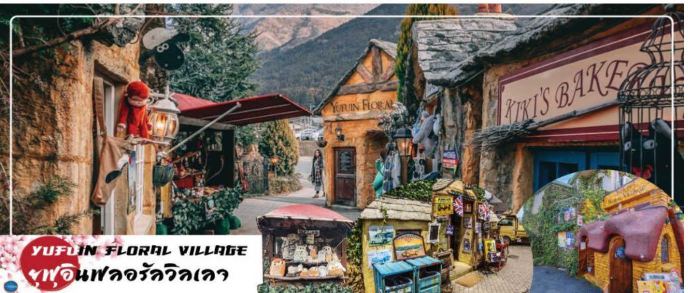
YUFUIN FLORAL VILLAGE ยฟูอินฟลอรัลวิลเลจ

เช้า รับประทานอาหารเช้า ณ ห้องอาหารของโรงแรม (2) นำท่านสู่ บ่อนรกเบปปุ จิโกคุ เมกิริ (Beppu Jigoku Meguri Or Hell Tour) หรือบ่อน้ำพุร้อนชุมชนรกร้างแปด เป็นบ่อน้ำพุร้อนธรรมชาติที่เกิดขึ้น ภายหลังจากการระเบิดของภูเขาไฟ ประกอบไปด้วยแร่ธาตุที่เข้มข้น เช่น กำมะถัน แร่เหล็ก โซเดียม คาร์บอนเนต เรเดียม เป็นต้น และร้อนเกินกว่าจะลงไปอาบได้ แล้วบ่อทั้ง 8 บ่อ ก็ตั้งชื่อให้แปลกตามลักษณะภายนอกที่เห็น (ให้ท่านเข้าชม 2 บ่อ) นำท่านสู่ เมืองยฟูอิน (Yufuin) เมืองเล็กๆ ในจังหวัดโออิตะ (Oita) ที่รู้จักกันดีในฐานะแหล่งออนเซ็นชื่อดัง และที่นี่ก็เต็มไปด้วยสถานที่น่ารักๆ มีถนนที่เรียงรายไปด้วยคาเฟ่และร้านขายของเก่า ของกระจุกกระจิกมากมาย ระหว่างทางไม่ควรพลาดที่จะแวะ ยฟูอิน ฟลอรัลวิลเลจ (Yufuin Floral Village) ธีมปาร์คในบรรยากาศแห่งเทพนิยายที่ดูราวกับกำลังหลงเข้าไปในเหมือนจำลองหมู่บ้านสไตล์ยุโรป ร้านค้าทุกหลังเป็นสีเหลืองที่มีแต่ร้านที่