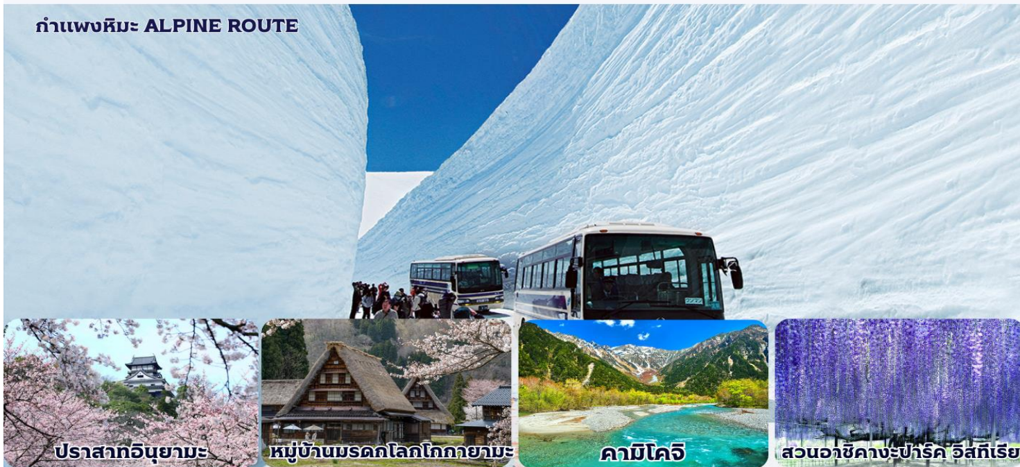
ปราสาทอนูยามะ