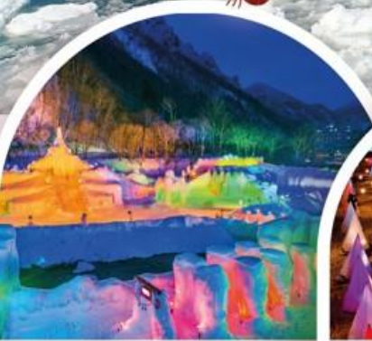
เทศกาลน้ำตกน้ำแข็งโซอุนเคียว