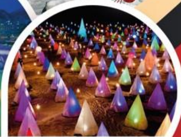
Tokachigawa Onsen Hakucho Festival Sairinka