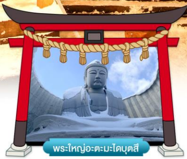
พระใหญ่อะตะมะโคบุตสึ