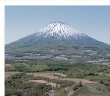
ภูเขาโยเท