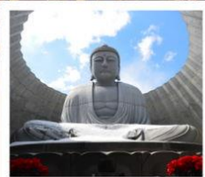
เป็นพระพุทธรเจ้า