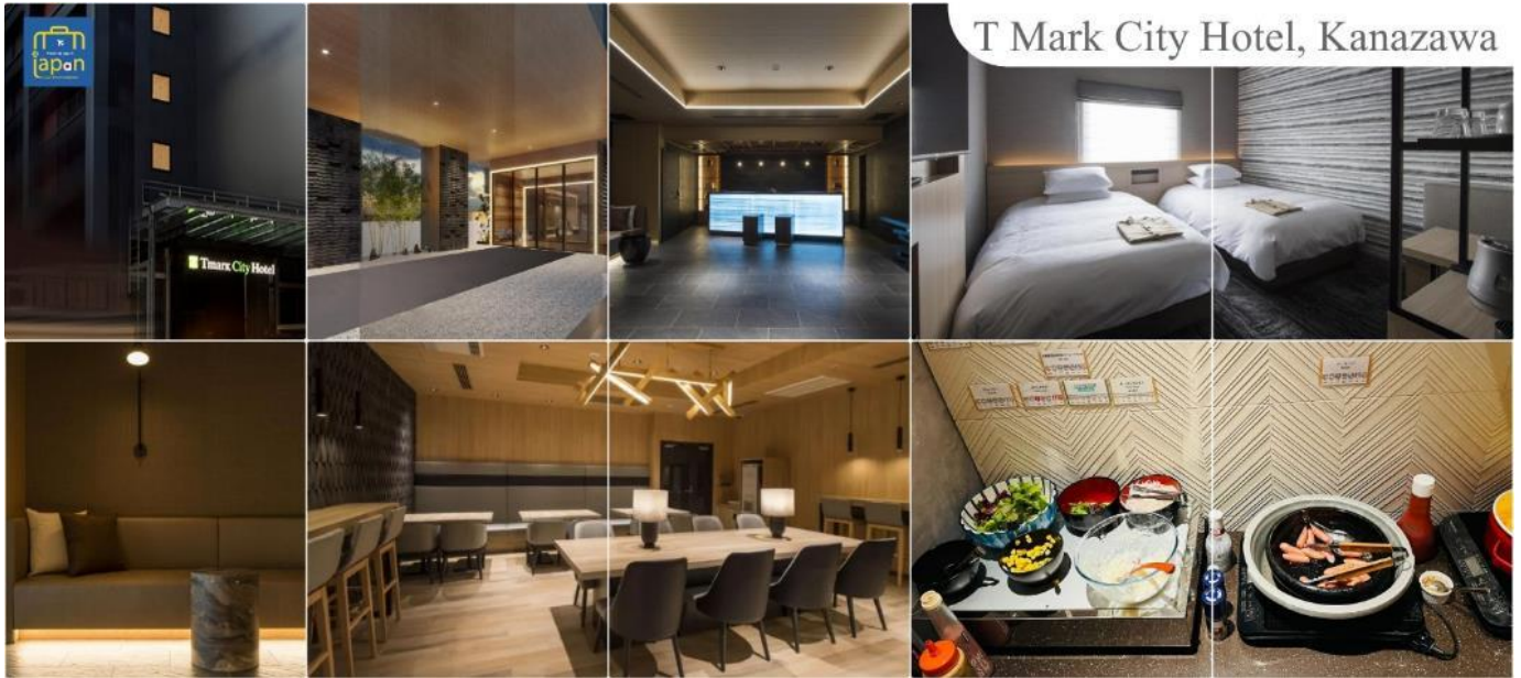
T Mark City Hotel, Kanazawa