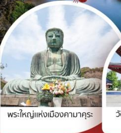
พระใหญ่แห่งเมืองคามาคุระ