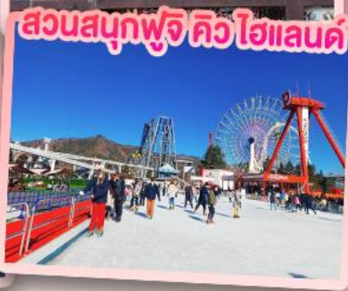
สวนสนุกฟูจิ คิว โฮแลนด์