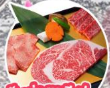
ปิ้งย่างพรีเมียม Rokkasen