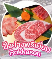
ชั่งย่างพรีเมียม Rokkasen