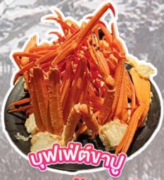
บุฟเฟ่ต์น๊ากู