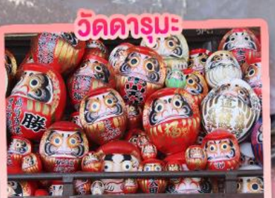
วัดดามารุะ