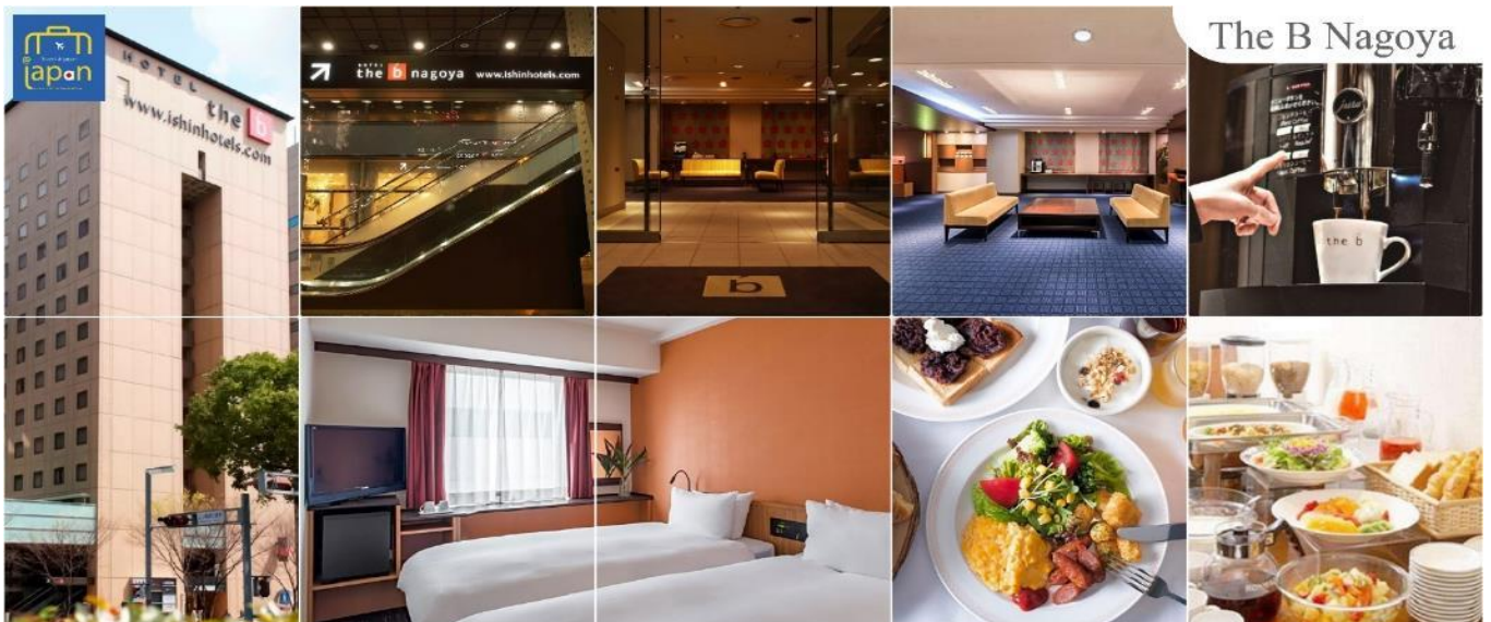
The B Nagoya

พักที่ HOTEL THE B NAGOYA หรือเทียบเท่าระดับเดียวกัน