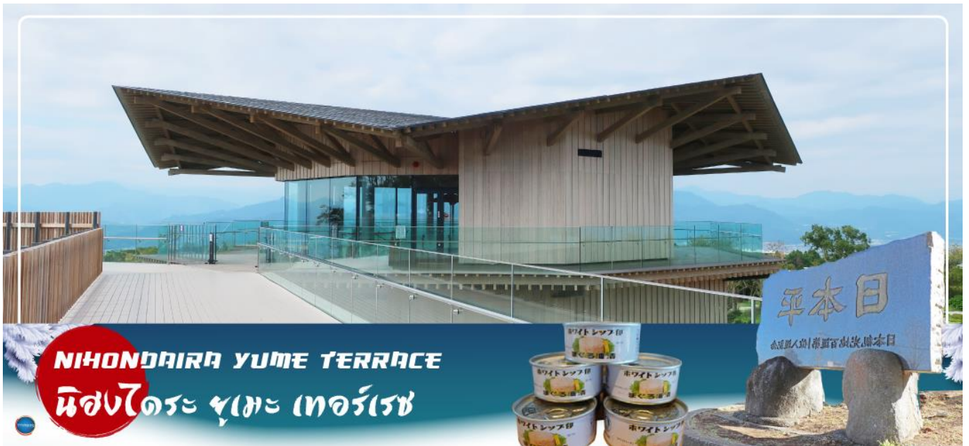
NIHONDAIRU YUME TERRACE นิฮงไดระ ยูเม เทอร์เรซ

และบรรยากาศของเมืองโดยไร้สิ่งกีดขวางพร้อมภูเขาไฟฟูจิได้แบบ 360 องศา มีสะพานที่เชื่อมระหว่างระเบียงกับทางเดินไปยังที่จอดรถ นอกจากนี้ยังมีการจัดแสดงนิทรรศการ และคาเฟ่ สำหรับให้ท่านได้เพลิดเพลิน จิบนม ชิมกาแฟ สัมผัสบรรยากาศดี ๆ กับวิวภูเขาไฟฟูจิตามอัธยาศัย