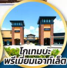
โทเทมบะ-พรีเมียมเอทาลีต์