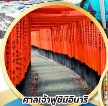
ศาลเจ้าฟูชิมิอินาริ