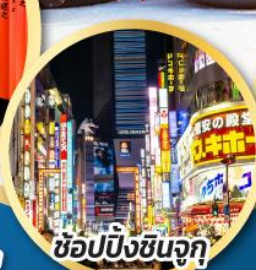
ช้อปปิ้งชินจูกุ