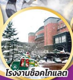
โรงงานช็อคโกแลต