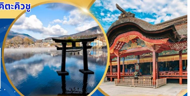
ทะเลสาบคินริน